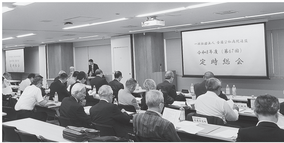
定時総会のもよう(会場：食品衛生センター)

結び、会員の皆様並びに関係各位の皆さまのご健勝とご発展を心よりお祈り申し上げますとともに、私自身も「未だ木鶏たりえず」の精神を忘れることなく、全国公私病院連盟のさらなる発展のため全力を尽くしてまいります。今後とも温かいご支援とご協力を賜りますようお願い申し上げます。就任のご挨拶といたします。